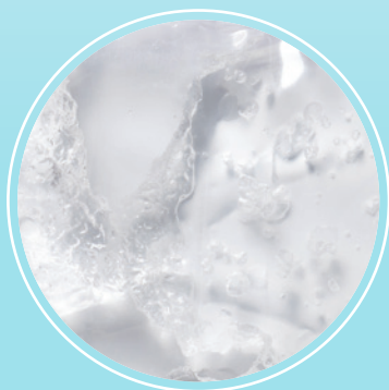
NEMRZNOUCÍ GELOVÉ JÁDRO